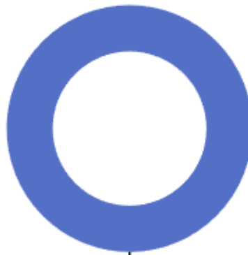
自然资源海洋气象等支出

2026年度泽州县气象局一般公共预算当年支出223.64万元,主要用于以下方面：自然资源海洋气象等支出223.64万元,占100.00%等。本单位为中央垂管单位,地方政府承担部分气象服务支出